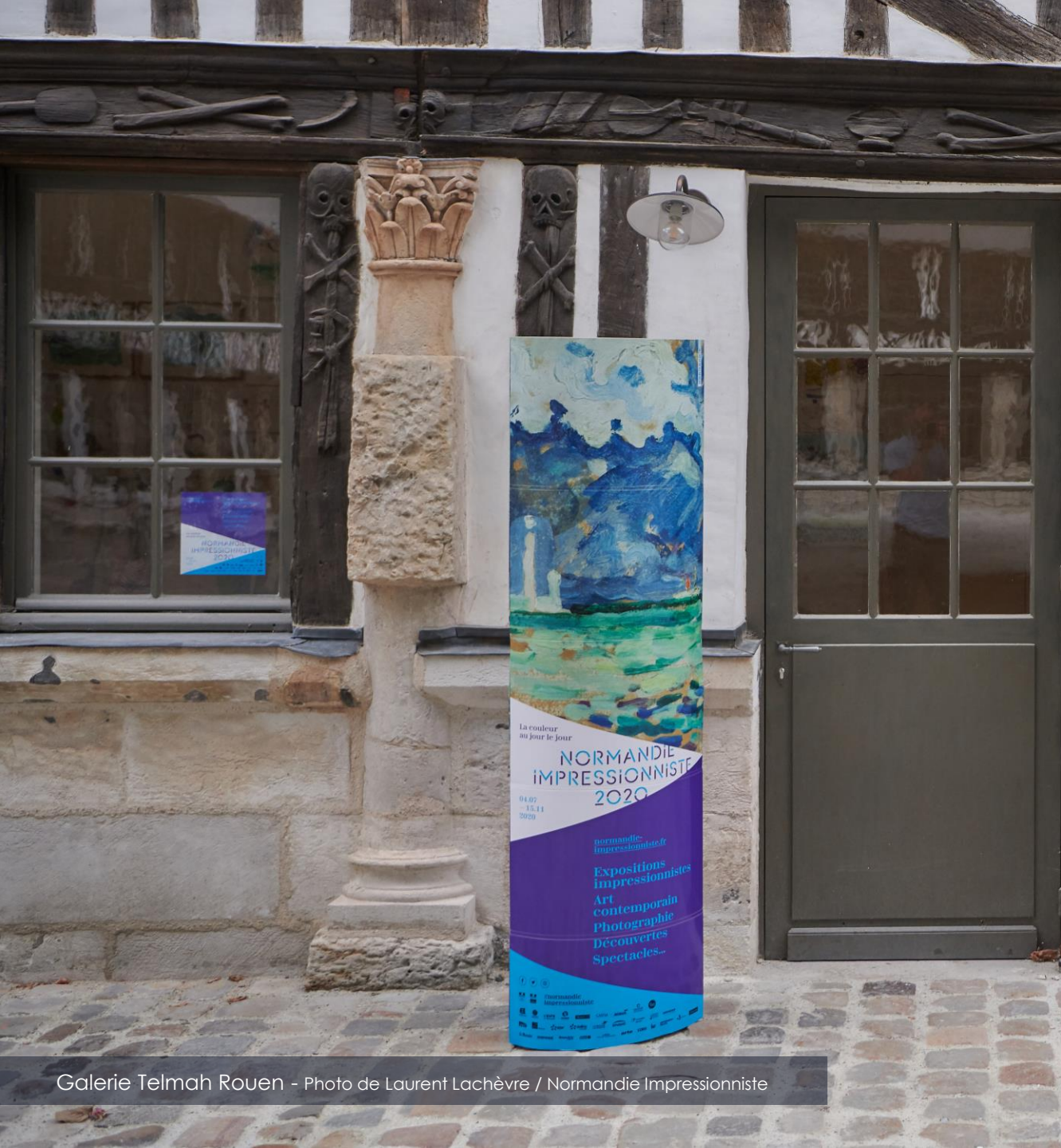
Galerie Telmah Rouen - Photo de Laurent Lachèvre / Normandie Impressionniste