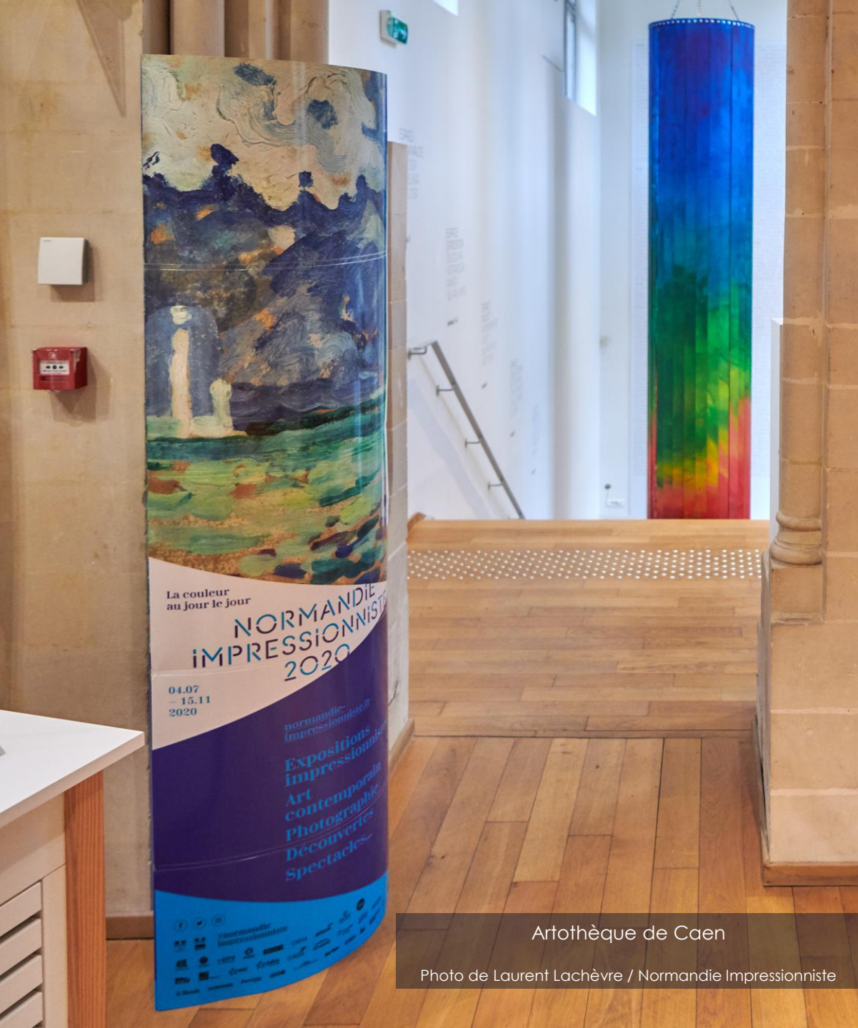
Artothèque de Caen