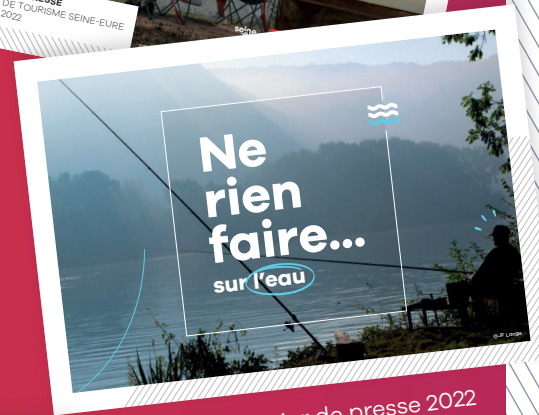
dossier de presse 2022