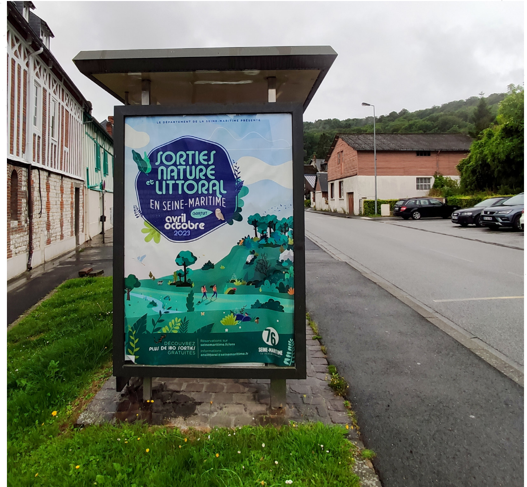
Abris-bus à Villequier - Rives-en-Seine