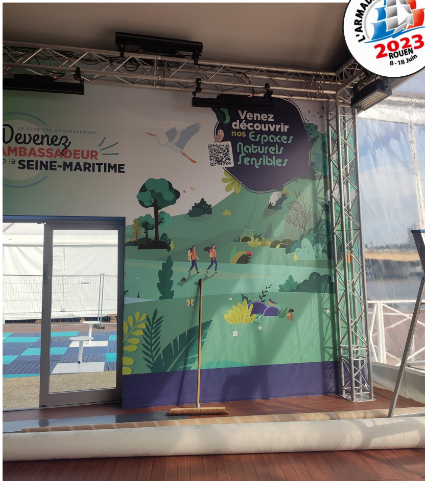
Habillage du mur du stand du Département pendant l'Armada.