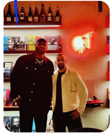
LeBron James (Basket NBA) @kingjames

Nous gérons les comptes Instagram de Mr.T Paris et Los Angeles avec des publications régulières, des stories engageantes, et un community management actif pour renforcer le lien avec les abonnés. Tous les 3 à 4 mois, nous organisons des shootings pour produire des visuels de qualité. En parallèle, des campagnes publicitaires ciblées et des collaborations avec des influenceurs locaux accroissent la notoriété de Mr. T sur les deux marchés. Un reporting mensuel nous permet d'optimiser continuellement notre stratégie pour une visibilité maximale.