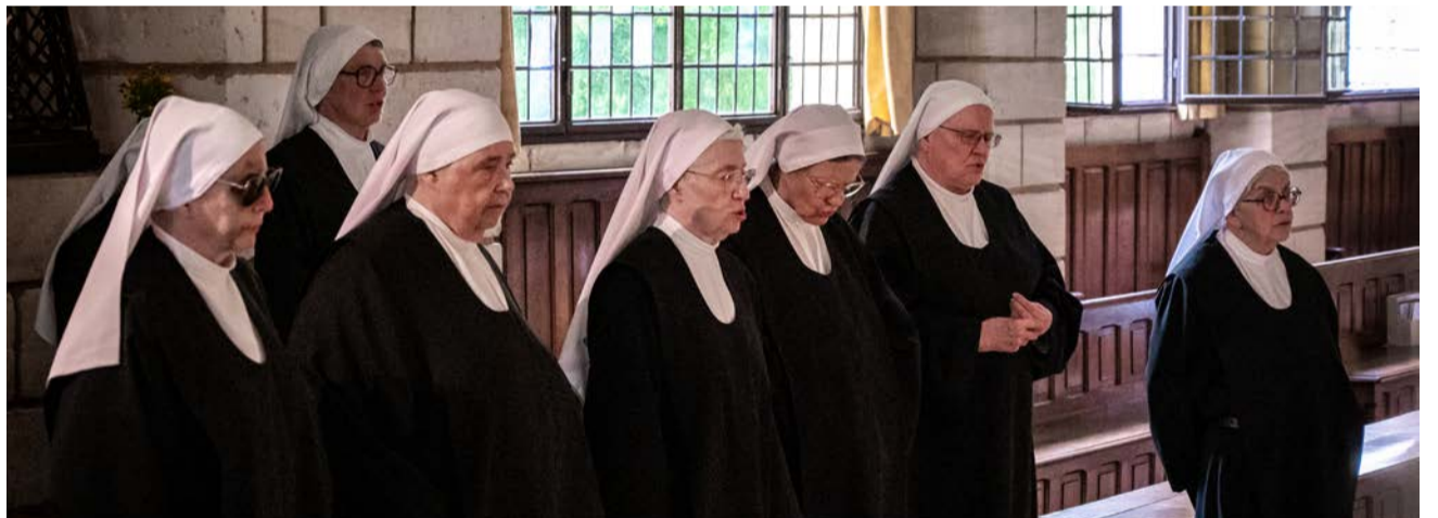
Les moniales bénédictines oblates du monastère Sainte-Françoise Romaine du Bec-Hellouin, à 2 km de l'abbaye.