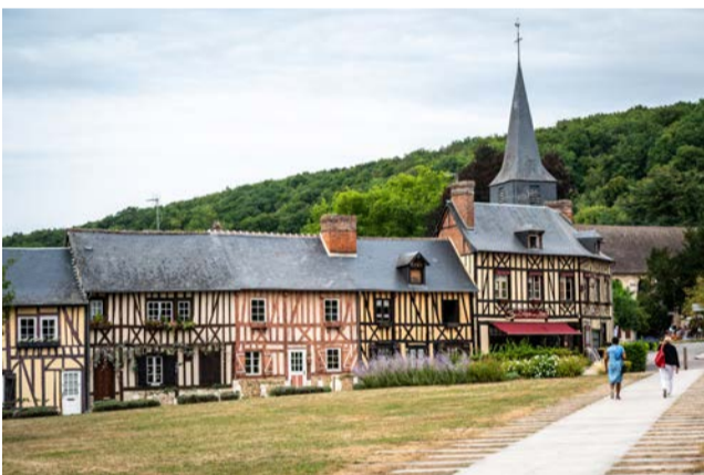
Départ : le village du Bec-Hellouin, qui abrite l'abbaye du Bec.

Les rares personnes rencontrées l'ont été sur les voies vertes. Sur celle reliant Bernay à Broglie, je suis tombé sur Guy. Le sexagénaire fut le seul marcheur croisé à connaître les chemins du Mont-Saint-Michel, ayant même été un temps membre de l'association. Le bipède suréquipé conspuait les cyclistes, « qui foncent comme des voitures ». D'aucune chapelle, j'ai refusé de choisir mon camp.