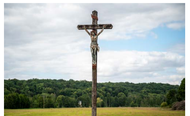
L'un des nombreux calvaires, ici près de Ferrières-Saint-Hilaire.