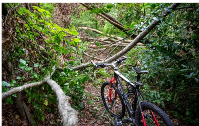
Passages difficiles pour un marcheur, a fortiori un vététiste !