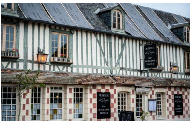
L'auberge du Donjon à Brionne, étape entre deux parcours.