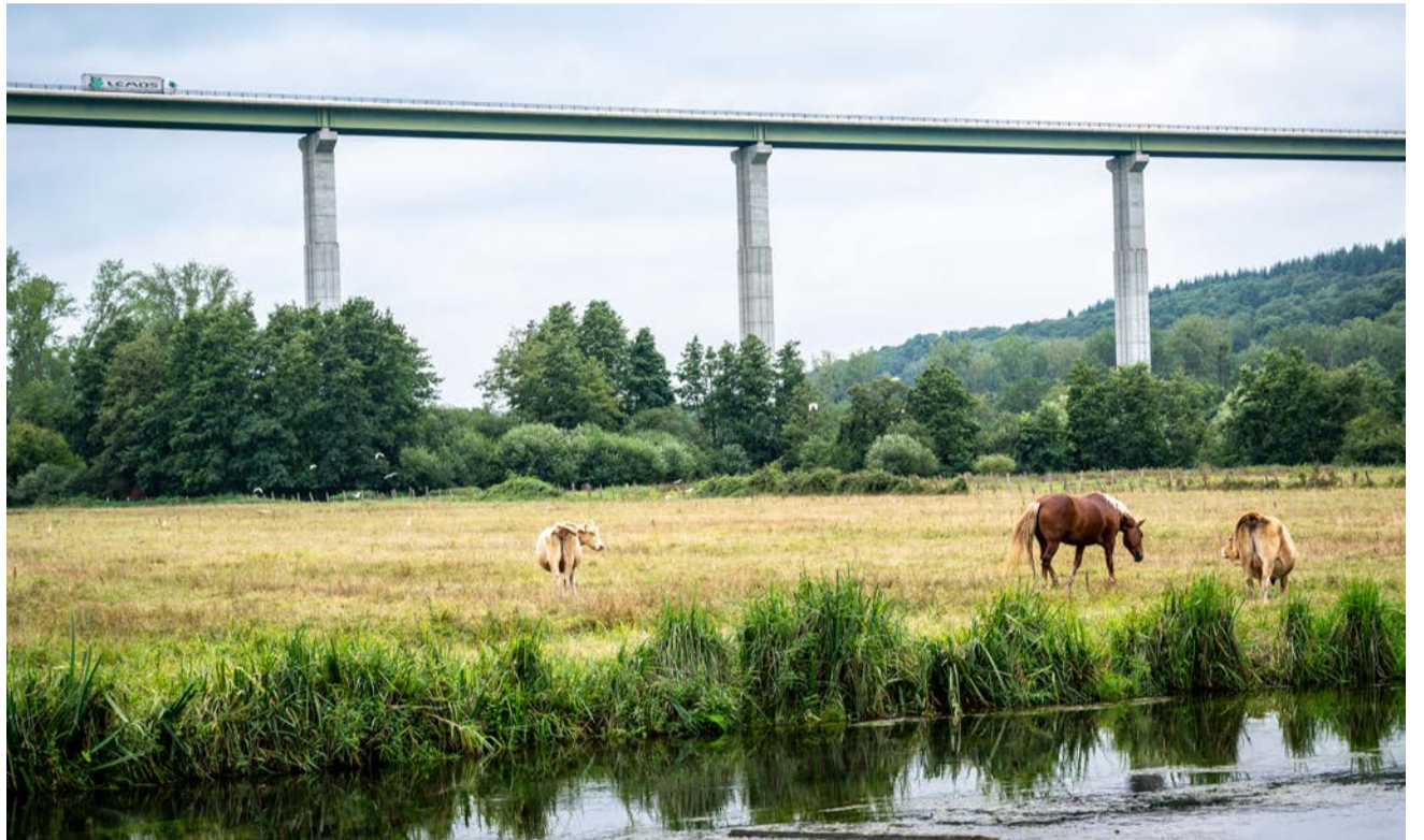
Sous le viaduc de l'A28, l'idyllique vallée de la Risle entre Aclou et Fontaine-la-Soret, avec chevaux, vaches et aigrettes.

Le monastère Sainte-Françoise Romaine et la vallée de la Risle vus du ciel. La quatrième étape des chemins du Mont-Saint-Michel, qui part de Montfort-sur-Risle pour aller à Brionne, emprunte la forêt que l'on voit au fond, où chemine également la voie verte.