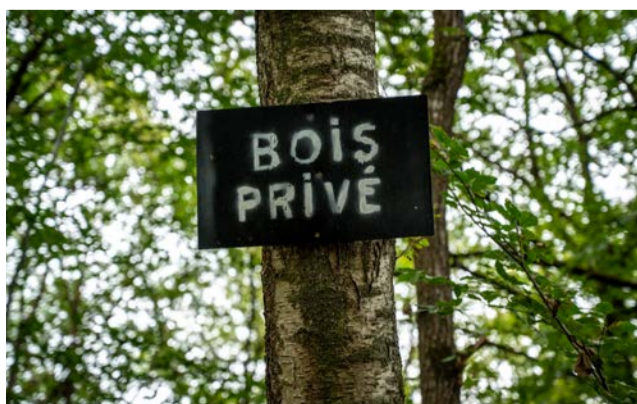
Certains passages signalés empruntent des forêts privées.