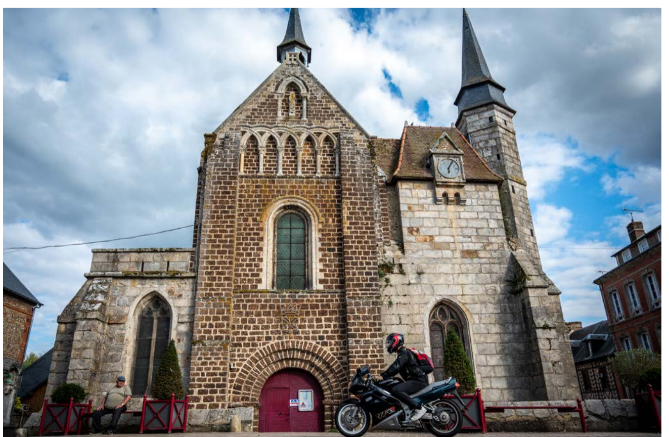
Arrivée : l'église Saint-Martin de Broglie, devant laquelle ce clou en bronze a été posé en septembre dernier.