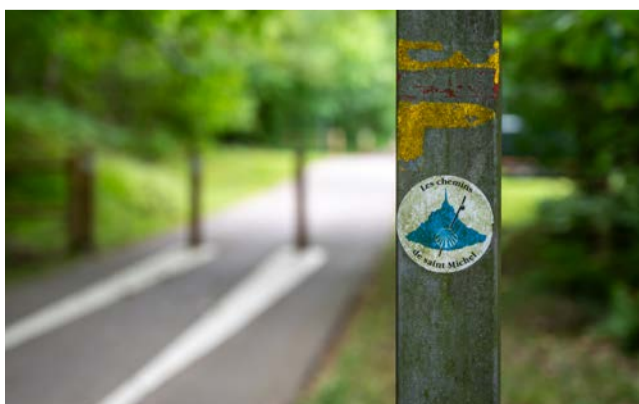
Le macaron de l'association guide le pèlerin sur les chemins.