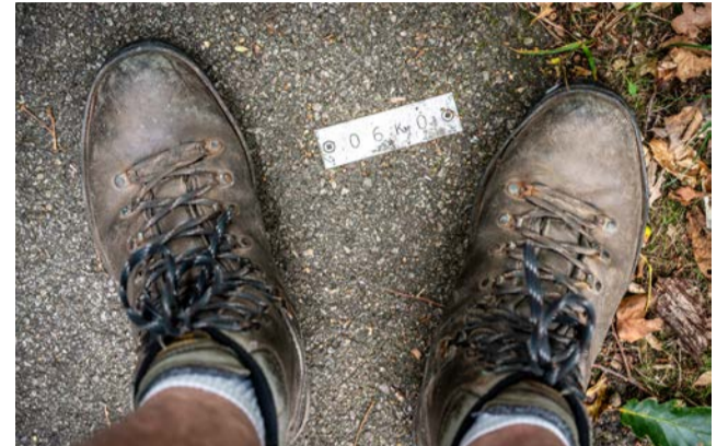
De Bernay jusqu'à Broglie à pied.

passages sont barrés d'enchevêtrements inextricables de troncs et branchages qui barrent le sentier. Des arbres tombés de frais aux feuilles mortes encore présentes sur les branches, très probablement victimes des deux épisodes météorologiques violents qu'a subis le département les 13 et 25 juin derniers.