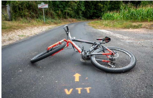
Du Bec-Hellouin jusqu'à Bernay à VTT.