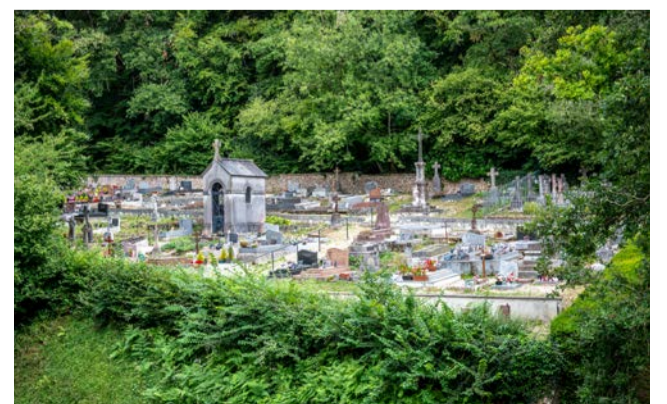
Memento mori: le cimetière de Saint-Quentin-des-Isles.