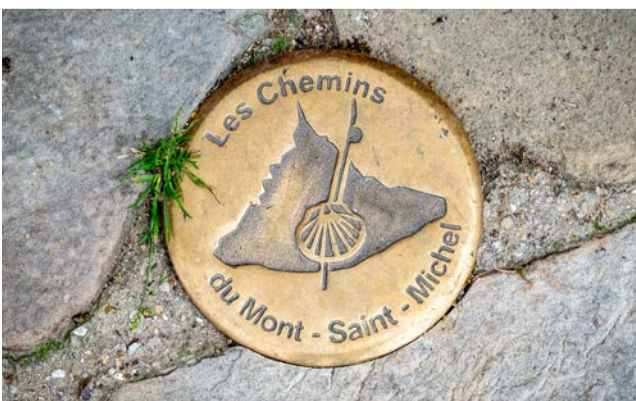
Le seul clou en bronze poli de 15 cm qui jalonne ce parcours.