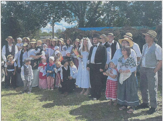
Parmi les nombreuses animations au programme du Festival rétro du dimanche 17 août, un grand défilé en tenues d'époque est annoncé en début d'après-midi.

■ Pratique. Le Clos de la Forge, dimanche 17 août de 10h à 23h. Tarif : 7€, gratuit - 12 ans.