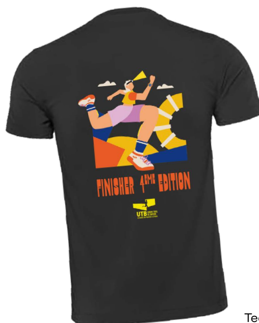
Tee-shirt finisher à l'image de l'affiche