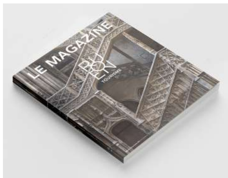
ROUEN TOURISME N°1

La Gastronomie: Rouen est la seule ville en France à faire partie du réseau des villes créatives Unesco en matière de gastronomie.