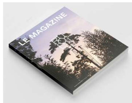
ROUEN TOURISME N°6