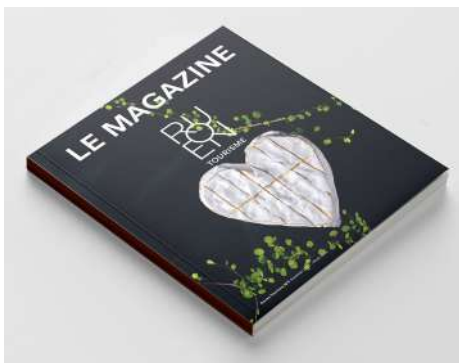
ROUEN TOURISME N°5