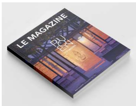
ROUEN TOURISME N°7