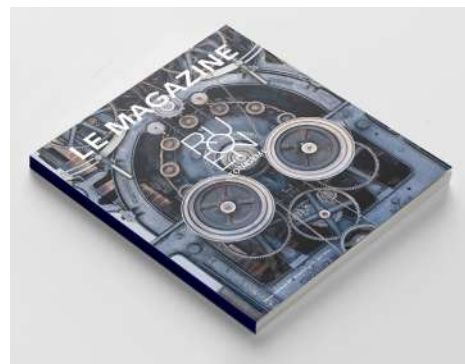
ROUEN TOURISME N°3