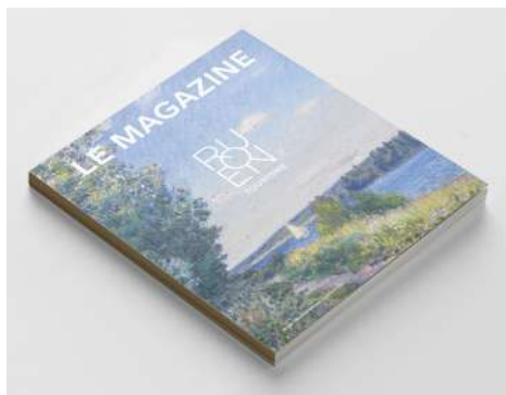
ROUEN TOURISME N°4